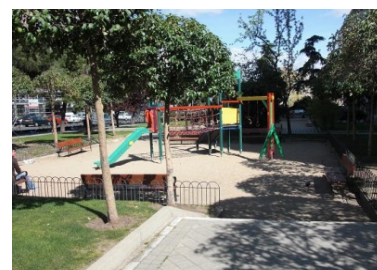
Il parco giochi