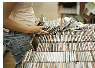
Il negozio di dischi