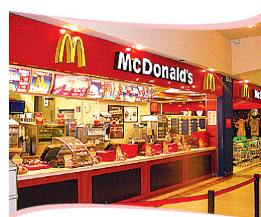
Il fast food