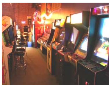
La sala videogiochi