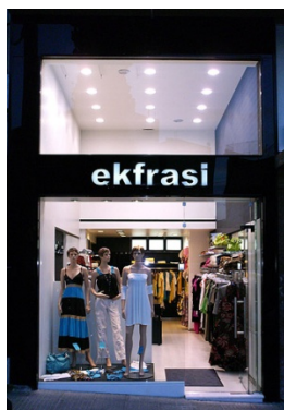
Il negozio di abbigliamento

Γράψε ένα μήνυμα σε έναν ιταλό μαθητή που θα έρθει να μείνει στο σπίτι σου για 10 μέρες, στο πλαίσιο ευρωπαϊκού προγράμματος. Πες του πώς είναι η γειτονιά σου. Οι φωτογραφίες θα σε βοηθήσουν να κάνεις μια περιγραφή της γειτονιάς σου και των καταστημάτων της (30-40 λέξεις).